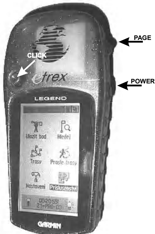
obrázok číslo 1