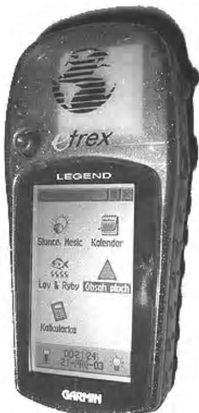
obrázok číslo 2